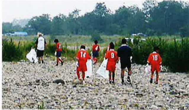
鬼怒川クリーン大作戦

毎年夏に鬼怒川グリーンカップ・鬼怒川クリーン大作戦を主催し、多くの子供たちと共に、スポーツの振興及び河川清掃による環境美化を進めています。 サッカートーナメントと併せて清掃活動を行い、子どもたちにルールやマナーを守ることの重要性と環境保全の大切さを伝えています。