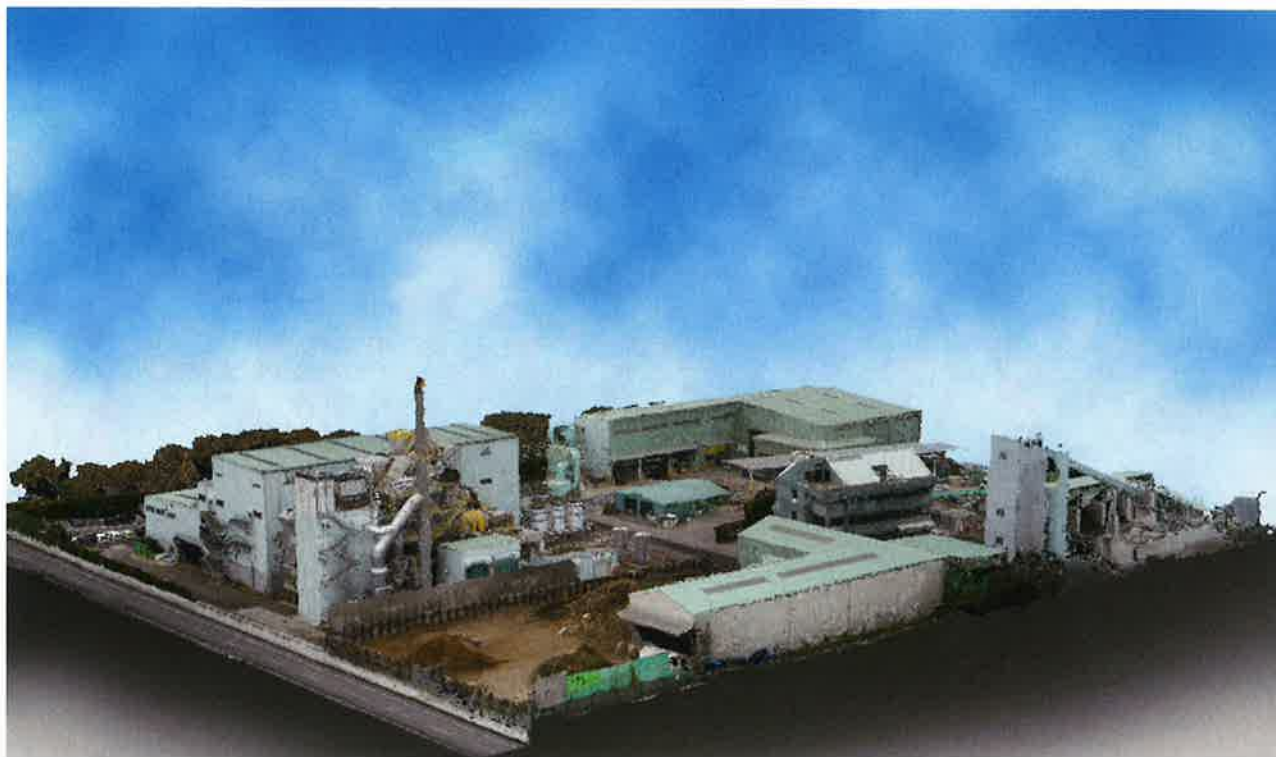
点群データパーパス